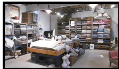
Cotswold Woolen Weavers