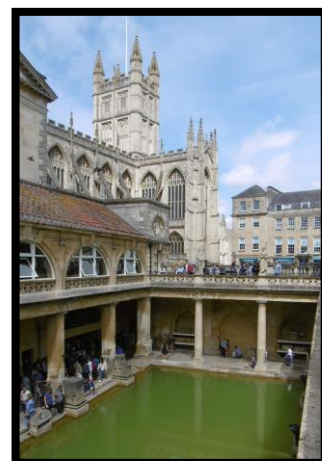
Romerska baden i Bath

En lugn och avkopplande dag i Bath. Vårt hotell ligger vackert beläget vid floden Avon och man promenerar lätt på ca 15 minuter längs stranden till centrum med katedralen och shoppinggatorna. Bath är unik stad i England med sin enhetliga arkitektur, badanläggningar och museer. Jane Austen Centre är ett intressant museum, som visar Bath under sin blomstingtid. För de som önskar gör vi extra halvdagsutflykt till orten Cheddar, känt för sitt vackra läge i Mendip Hills och framför allt ost-tillverkning. Kostnad 100:- (beställes på resan) (F, M)