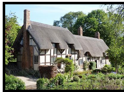
Anne Hathaways Cottage

Denna utflykt går genom den södra delen av the Cotswolds. Förr i tiden var den stora inkomsten att bedriva fåravel. Ullindustrin lever delvis kvar och vi börjar dagen med ett besök på "Cotswold Wollen Weavers" ett kombinerat museum, affär och "coffee shop". Nästa stopp är den lilla byn Bampton, som på senare år rönt stor uppmärksamhet, tack vare den populära TV-serien "Downton Abbey". Kyrkoscenerna, bygatan och familjen Crawleys hus är filmade här. Ni får tid att gå in i kyrkan och husen runt omkring. Lunchstoppet blir i den charmiga byn Burford. Dess huvudgata "High Street" är vida känt för sin svepande linje ner mot floden Windrush och obrutna linje med gamla hus med affärer och restauranger. Sista byn för dagen är Stow-on-the-Wolds, en gång i tiden Cotswolds mest betydande stad tack vare ullindustrin. I dag flockas besökarna kring det stora torget, som kantas av vackra hus, många affärer, gallerier och antik-affärer. Återkomst till hotellet vid 16-tiden. Middag på hotellet. Vår by, Bourton är också den mycket välbesökt av turister. Det lilla vattendraget i centrum har givit byn ett smeknamn "Cotswolds Venedig". Kanske en överdrift men mysigt med sina smäckra broar kantad med parker och nätta små hus. Vårt hotell ligger ca 30 m från vattendraget. Dagsetapp 80 km. (F, M)