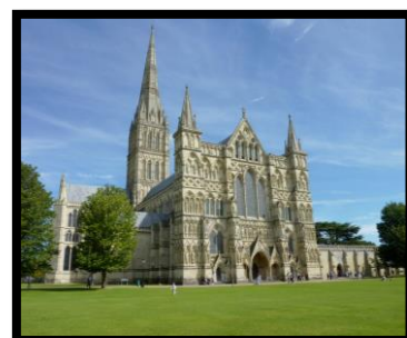
Katedralen i Salisbury

I grevskapet Wiltshire, som vi skall genomkorsa idag, finns ett av världens mest kända och mystiska fornlämningsområde, Stonehenge. Tillkom troligen redan för ca 4000 år sedan. Namnet betyder "De hängande stenarna" och det förstår man när man ser de enorma stenarnas storlek och placering. De väger mellan 25 – 30 ton och har forslats från ett område i södra Wales ca 35 km västerut. Vi har gott om tid för detta unika minnesmärke. I staden Salisbury med sin kända katedral, som bl.a. hyser ett original av Magna Charta från 1200-talet, tillbringar vi resten av dagen och kvällen. Vårt logi Mercure Hotel White Hart ligger mitt i centrum, ca fem minuters promenad till huvudgatan High Street och katedralen. (Dagsetapp 80 km) (F, M)