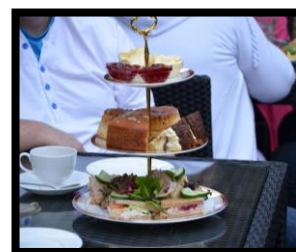
Afternoon tea (2 pers)