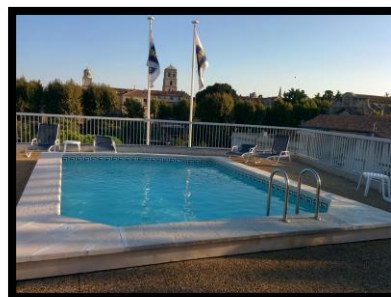
Arles BW Hotel Atrium

Hotel: Best Western Atrium Hotel är beläget i centrum av staden med ca 10 minuters promenad till den romerska arenan. 250 km (M)