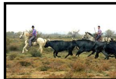
Tjurar i Camargue