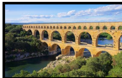
Pont du Gard