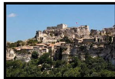
Les Baux i Alpillerna

Efter frukost lämnar vi Arles och tar motorvägen mot Nice. Den går huvudsakligen några mil från kusten. Vi far de sista milen ner mot kusten över bergskedjan Les Maures och kommer till badorten Sainte Maxime. Här gör vi uppehåll för ev. bad i havet och lunch. I västra utkanten av orten ligger Villa Mirage, som är kungaparets medelhavsparadis. Mittemot, på andra siden viken ligger St. Tropez, jet-set folkets inneplats. Från Sainte Maxime följer vi så kustvägen via St. Raphael, det vackra Esterel-massivets röda klippor, Cannes och Antibes innan ankomsten till Nice, Rivierans huvudort, där vi skall bo på 4*Mercurie Hotel Grimaldi de sista 3 nätterna på resan. Hotellet ligger ca 10 min promenad från stranden. 270 km (F, M)