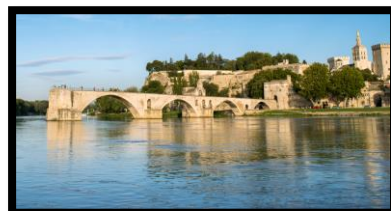
Pont Benezet, Avignon

Avignon och vindistriktet Chateauneuf du Pape Avignon ligger en timmes bussresa norrut längs floden Rhone. Det är en muromgärdad stad, ca 4,5 km lång, 39 torn och 7 portar. Innanför murarna hittar vi en stad som är rik på kultur men framför allt det massiva Påvepalatset, ett Vatikanen i miniatyr. En annan sevärdhet i Avignon är den berömda bron över Rhone, känd från dansvisan "Sur le pont d'Avignon". Vid lunchtid åker vi några mil till vinområdet Chateauneuf du Pape och äter lunch och besöker en vinodlare. På återvägen mot Arles beser vi ännu en mäktig lämning från romartiden, akvedukten Pont du Gard, en valvbro i tre våningar från omkring första århundradet e.Kr. Återkomst till Arles vid 17-tiden. 150 km (F, L)