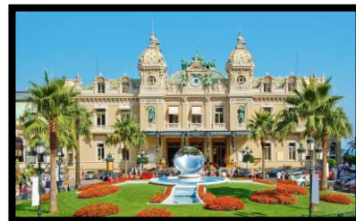
Kasinot, Monte Carlo