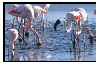
Flamingo i Camargue